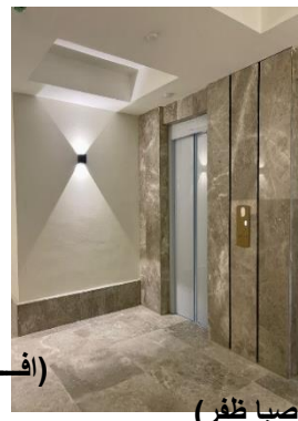
(افرا صبا ظفر)