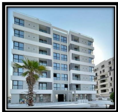
(پروژه افرا صبا کیش)