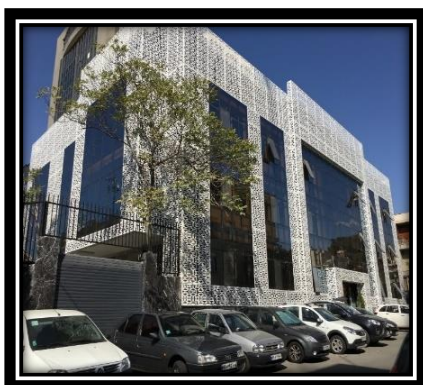
(پروژه بازسازی کوه نور)

در جهت کاهش مصرف انرژی، آلودگی هوا و رعایت مبحث 19 مقررات ملی و عایق سازی اجزای ساختمان دنبال میشود، در این جهت استفاده از پنجره های دوجداره (upvc)، دیوارهای عایق، عایق سازی کف و سقف ساختمان، عایقکاری لوله های تاسیساتی با استفاده از عایقهای پلیمری، مطابق مبحث مذکور در دستور کار قرار دارد. اجرای فضای سبز در پروژه ها یکی از اولویتهای اصلی شرکت بوده و پروژه بازسازی کوه نور دارای فضای سبز مناسب میباشد که باعث افزایش مطلوبیت پروژه مذکور گردیده است.