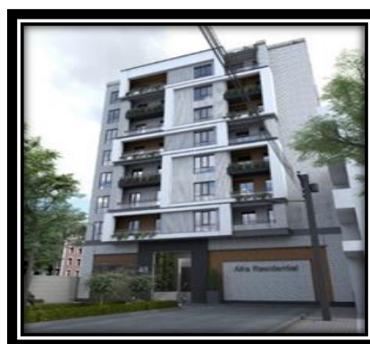
(پروژه افرا صبا ظفر)